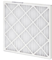
Filtro de horno de 20 "x 20" (MERV 13 o FPR 10)