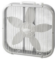
Ventilador de caja