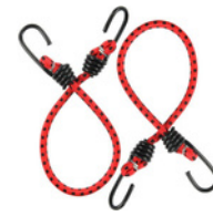
Opcional: cinta adhesiva o cuerdas elásticas